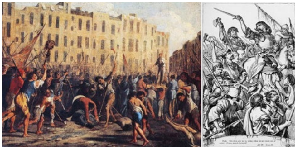
A sinistra, “Uccisione di padre Giuseppe Carafa”, 10 luglio 1647, di Domenico Gargiulo, Rivolta di Masaniello, Museo Nazionale della Ceramica 'Duca Di Martina'; a destra H.C. Selous' illustration of the Cade Rebellion in Act 4, Scene 2; from “The Plays of William Shakespeare: The Historical Plays”, edited by Charles Cowden Clarke and Mary Cowden Clarke (1830)