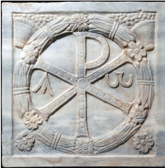
Città del Vaticano, Musei Vaticani, Museo Pio Cristiano, inv. 31550. Porzione di sarcofago con monogramma (V secolo).

del III secolo, questo segno venne associato nel IV alla madre dell'imperatore Costantino, Elena, e nel V divenne un simbolo dell'imperatore cristiano trionfante. È qui evidente che il processo di cristianizzazione dell'impero si accompagnò alla sua progressiva appropriazione dei segni grafici cristiani come segni comunicativi di autorità.