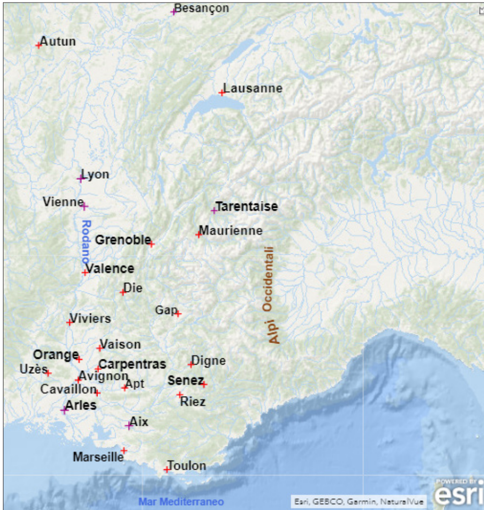
Fig. 2. Vescovi (in rosso) e arcivescovi (in viola) presenti a Mantaille.

nel corso di un'assemblea a Mantaille 8 . A questo concilio, infatti, parteciparono vescovi e arcivescovi provenienti essenzialmente dall'area della Borgogna rodaniana e della Provenza centro-occidentale. Questa area era piuttosto eterogenea e, come sottolineato già molti anni fa da Bautier, non aveva sicuramente un'identità "nazionale" o "etnica" (Bautier 1973), ma era unita da ragioni di opportunità politica.